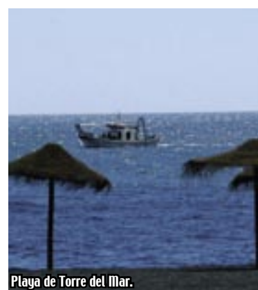
Playa de Torre del Mar.