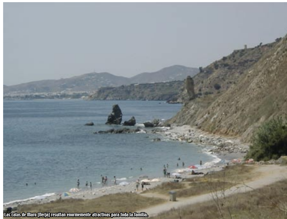
Las calas de Mar (Nerja) resultan enormemente atractivas para toda la familia.