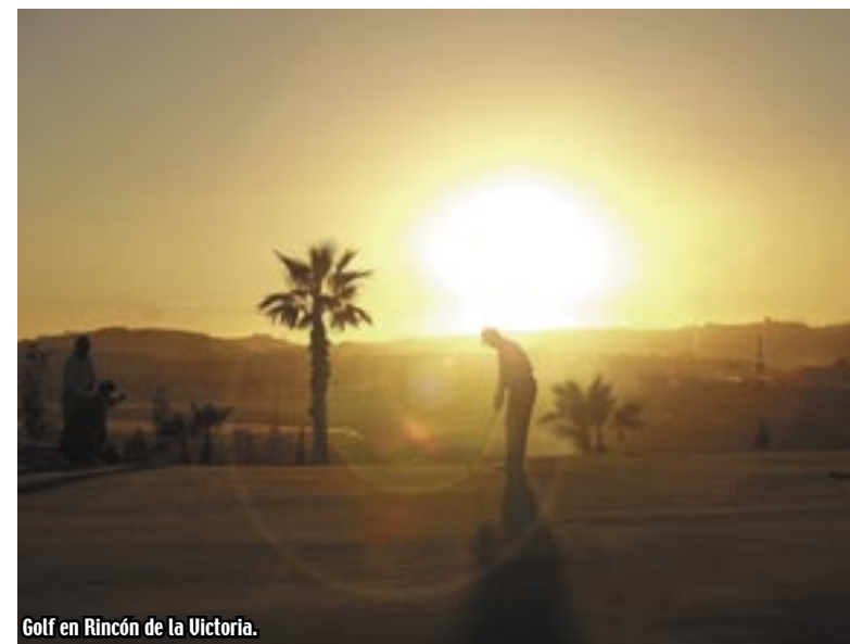
Golf en Rincón de la Victoria.