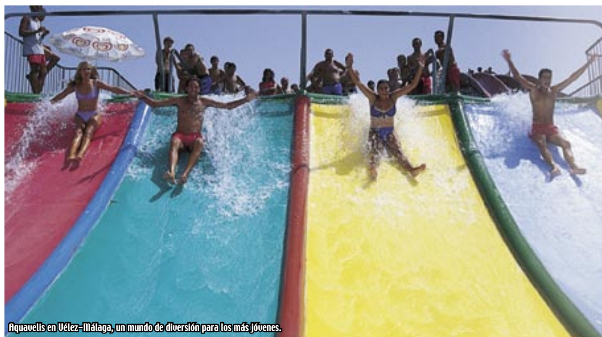
Aquavelis en Vélez-Málaga, un mundo de diversión para los más jóvenes.