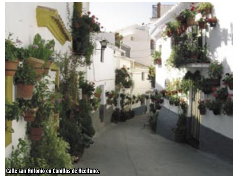
Calle san Antonio en Canillas de Aceituno.

Riogordo. Día del Caracol a finales de mayo Colmenar. Fiesta del Mosto y la Chacina en diciembre Alfarnate. Día de la Cereza en marzo Alfarnatejo. Fiesta del Gazpacho el primer fin de semana de agosto Periana. Día del aceite verdial en abril y Día del Melocotón en julio Alcaucín. Fiesta de la Castaña el 31 de octubre La Viñuela. Fiesta de la pasa en septiembre