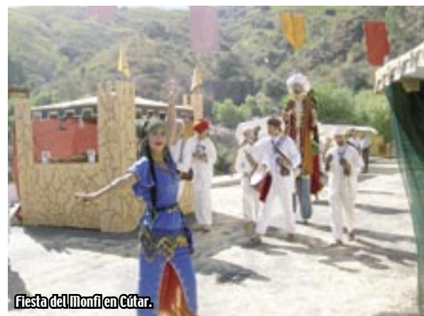
Fiesta del Monfi en Cútar.