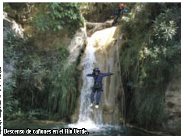
Descenso de cañones en el Río Verde.