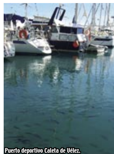
Puerto deportivo Caleta de Vélez.

tradición serrana. Esta abundancia de productos bien merece el homenaje anual que la comarca entera les otorga con sus celebraciones y degustaciones de productos típicos. La Fiesta de las Migas, del Boquerón, del Ajoblanco, de la Pasa, del Mosto y la Chacina, de los Caracoles, del Gazpacho, de la Morcilla, Noche del Vino o Día