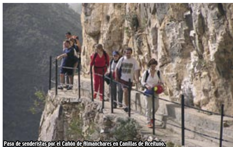
Paso de senderistas por el Cañón de Almanchares en Canillas de Aceituno.