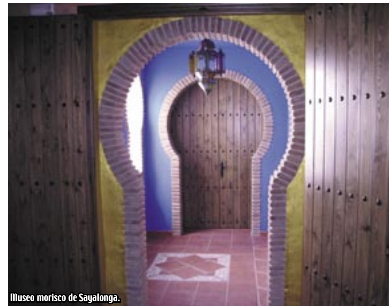
Museo morisco de Sayalonga.