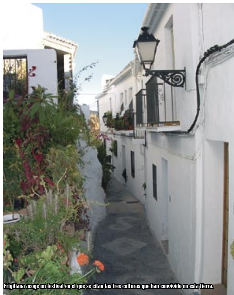
Frigiliana acoge un festival en el que se citan las tres culturas que han convivido en esta tierra.