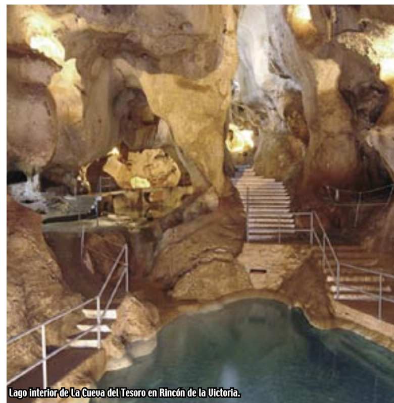
Lago interior de La Cueva del Tesoro en Rincón de la Victoria.