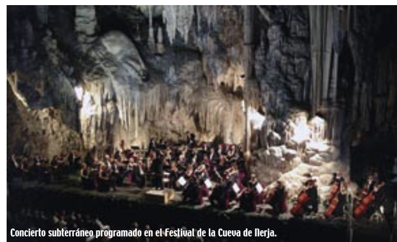
Concierto subterráneo programado en el Festival de la Cueva de Nerja.