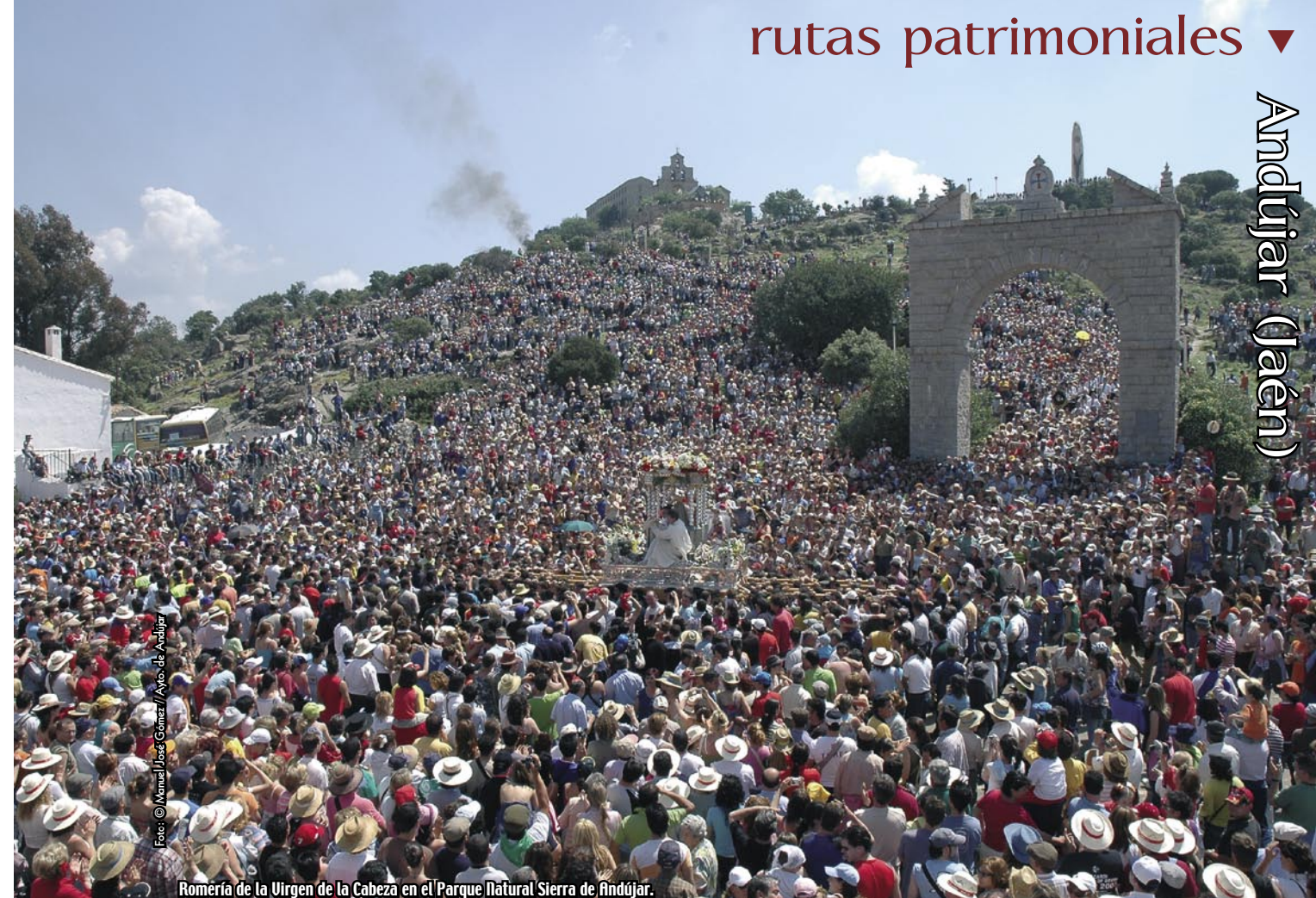
Romería de la Virgen de la Cabeza en el Parque Natural Sierra de Andújar.