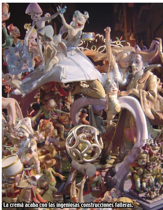
La cremà acaba con las ingeniosas construcciones falleras.