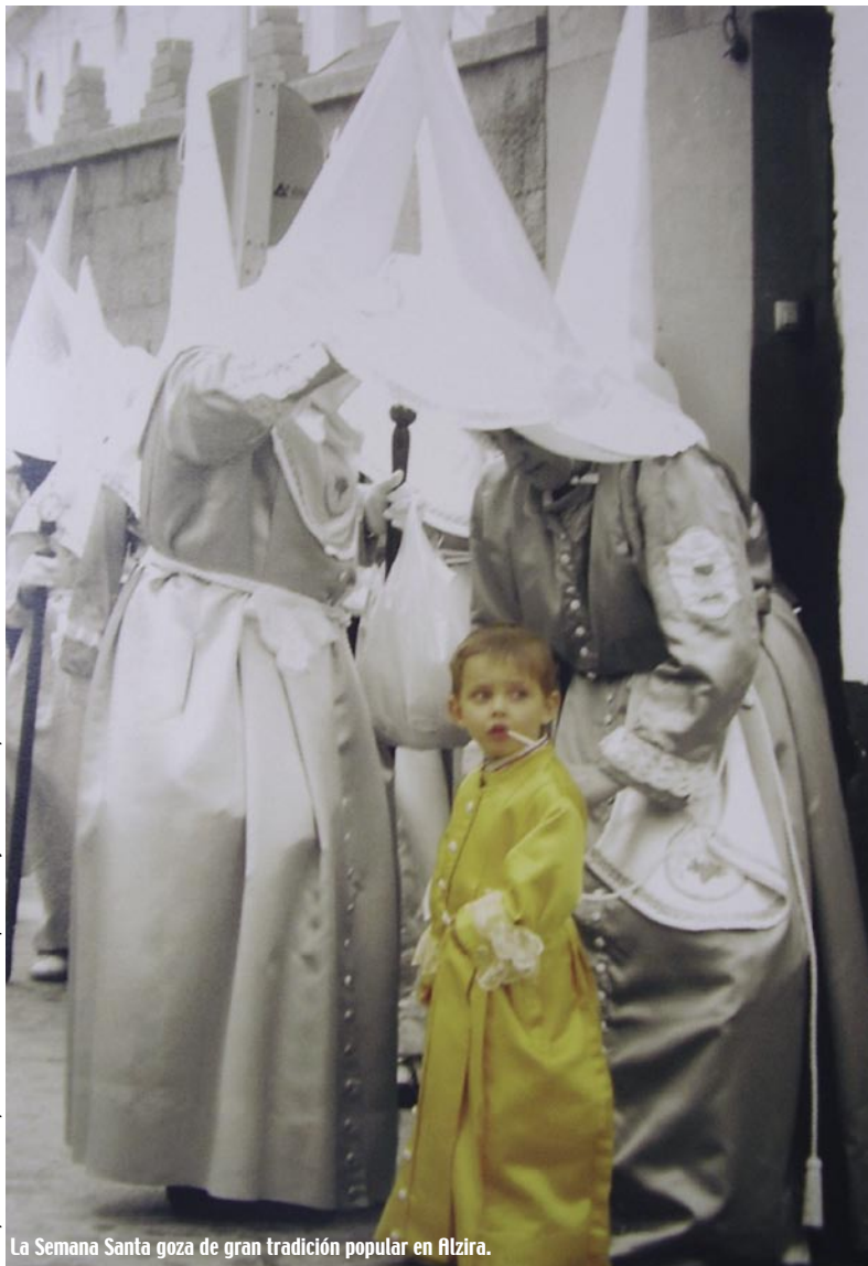
Texto y fotos: A. Ferrer y P. Benedito - Museo Municipal © Conceplla de Turismo. Ayuntamiento de Alzira