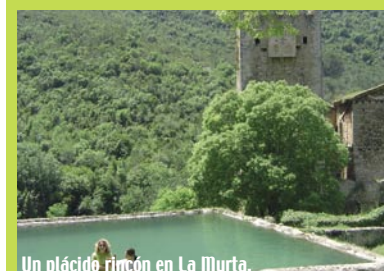
Un plácido rincón en La Ilurta.

Naturaleza. Para descansar merecidamente del bullicio de ambas fiestas, el término ofrece incomparables parajes donde practicar actividades de senderismo o cicloturismo, entre naranjos y frutales regados por una extensa red de acequias, o por los tranquilos valles que circundan las impresionantes serranías.