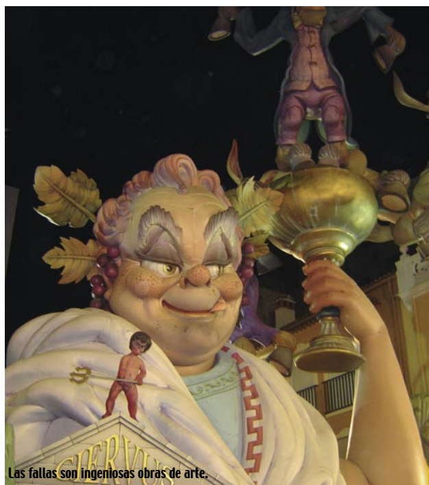
Las fallas son ingeniosas obras de arte.