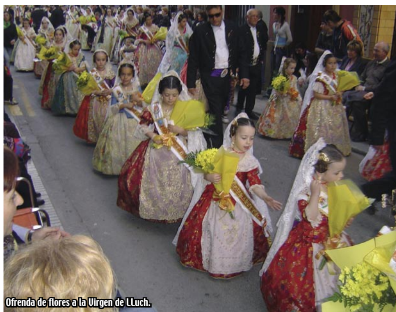
Ofrenda de flores a la Virgen de Lluçh.