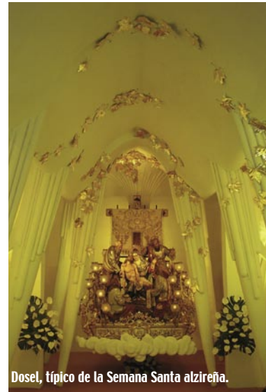
Dospel, típico de la Semana Santa alzireña.