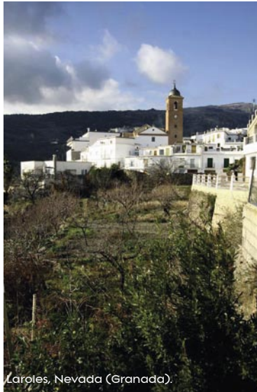
Laroles, Nevada (Granada).