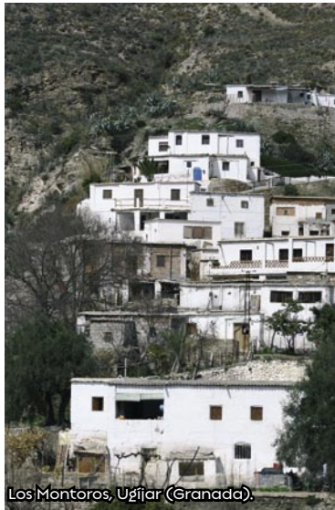
Los Montoros, Ugíjar (Granada).