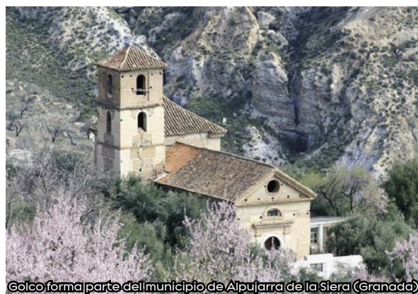
Golco forma parte del municipio de Alpujarra de la Siera (Granada).