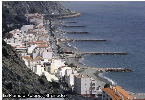
La Mamola, Pólopos (Granada).

protección para los trabajos con las caballerías ante las inclemencias del tiempo y un espacio de convivencia con los vecinos.