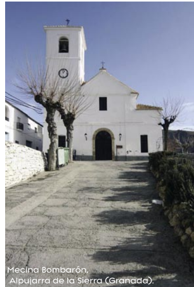
Mecina Bombarón, Alpujarra de la Sierra (Granada).