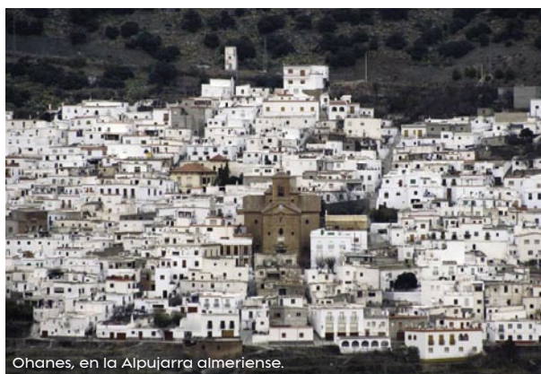
Ohanes, en la Alpujarra almeriense.