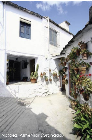
Notáez, Almegíjar (Granada).