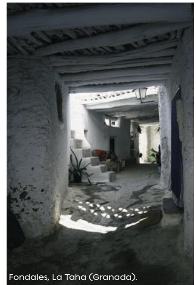
Fondales, La Taha (Granada).

cultural rural, que destaca especialmente por la armonía entre el medio natural y la actividad humana. La arquitectura y el urbanismo tradicional están entre sus más importantes manifestaciones y representan una perfecta muestra de equilibrio entre los asentamientos humanos y la naturaleza.