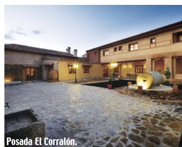
Posada El Corralón.