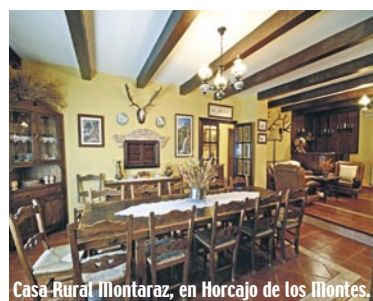
Casa Rural Montaraz, en Horcajo de los Montes.