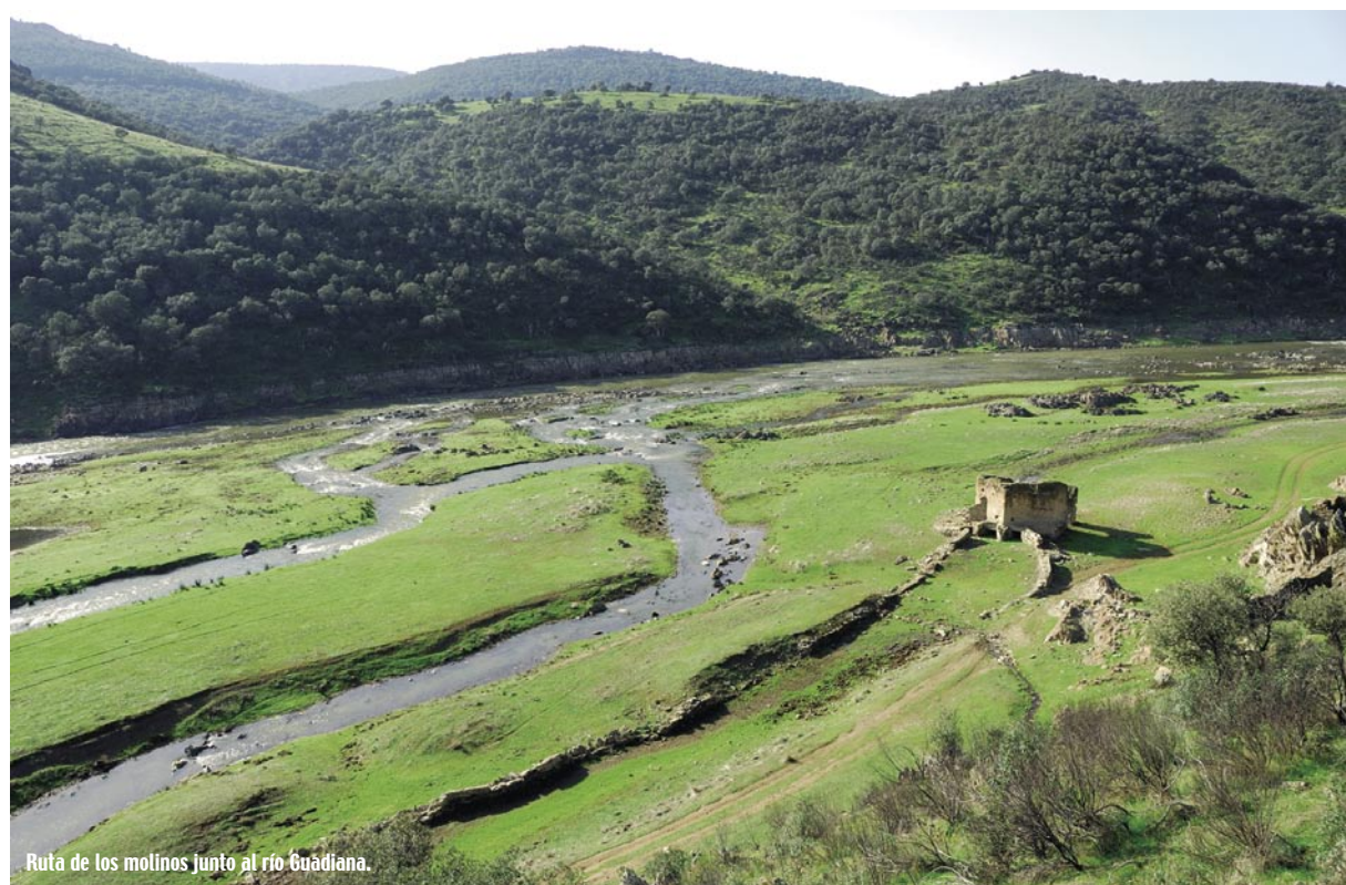
Ruta de los molinos junto al río Guadiana.