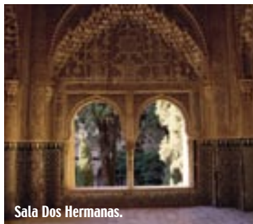
Sala Dos Hermanas.