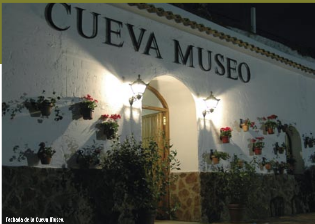
Fachada de la Cueva Museo.