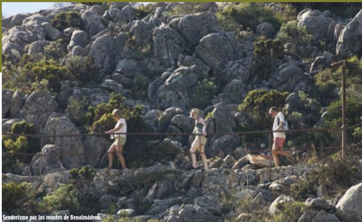
Senderismo por los montes de Benalmádena.