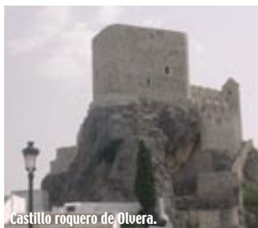
Castillo roquero de Olvera.