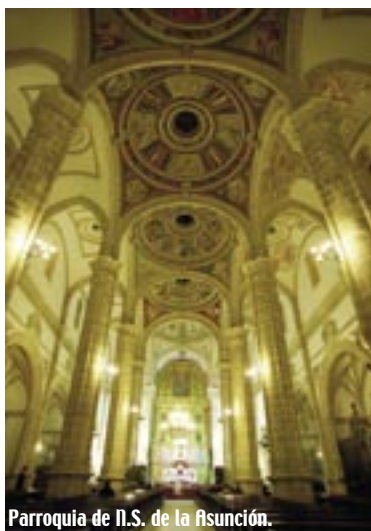
Parroquia de N.S. de la Asunción.