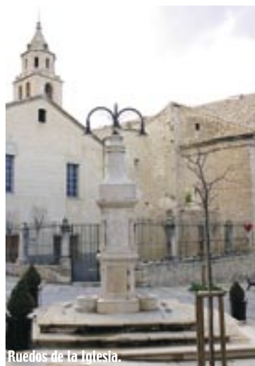
Ruedos de la Iglesia.