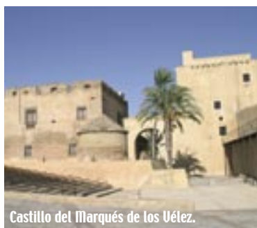
Castillo del Marqués de los Vélez.