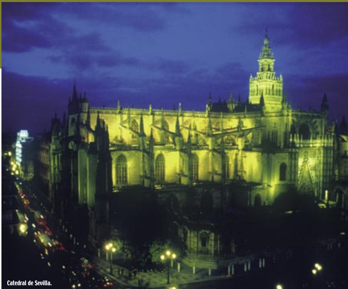
Catedral de Sevilla.

Minera cuentan la historia a través de castillos medievales, minas protohistóricas y vestigios arqueológicos de la Prehistoria.