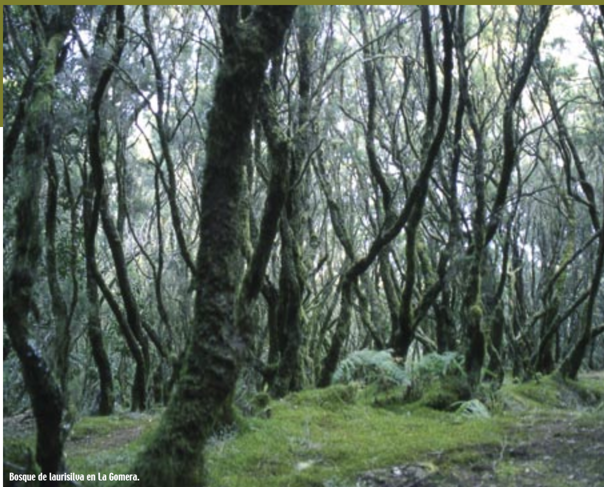
Bosque de laurisilva en La Gomera.