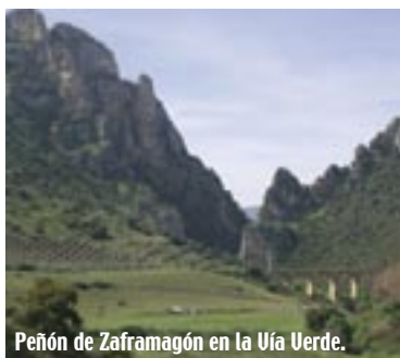
Peñón de Zaframagón en la Uía Verde.