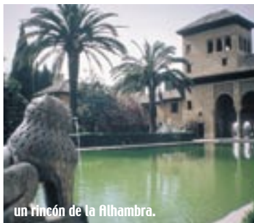
un rincón de la Alhambra.