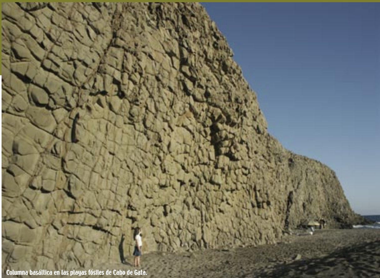
Columna basáltica en las playas fósiles de Cabo de Gata.