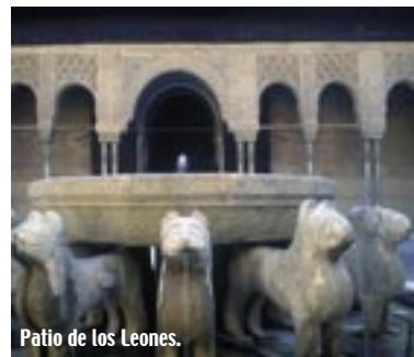
Patio de los Leones.