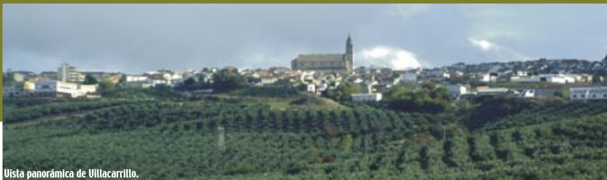
Vista panorámica de Villacarrillo.