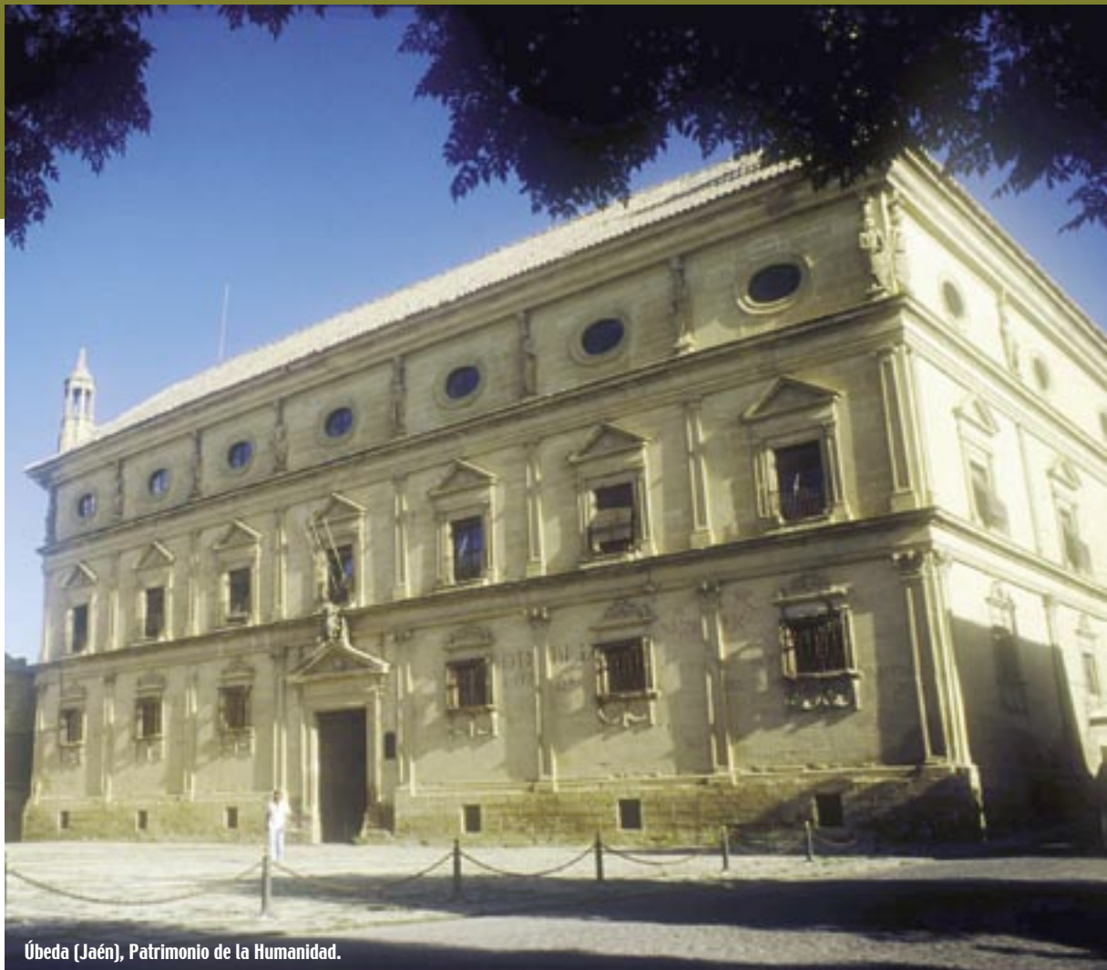
Úbeda (Jaén), Patrimonio de la Humanidad.

cios señoriales de aire colonial de la capital, lo ponen las fortalezas de Sanlúcar, Rota y el Puerto de Santa María, que otean las aguas que cantó el poeta Rafael Alberti. La Baelo Claudia romana, la Tarifa visigoda, ahora capital de los deportes acuáticos, y Algeciras, son otros de los destinos indicados para quienes buscan cultura y monumentalidad. Los amantes de la naturaleza se decantarán por las playas vírgenes de Bolonia y Zahara, por la pluviosidad de la Sierra de Grazalema y por la desembocadura del río Guadalquivir, que da la bienvenida al Coto de Doñana. Quienes prefieran la fiesta no deben perderse el Carnaval, en febrero, ni la Feria de Jerez, auténticamente andaluza donde bailan los caballos y corre el buen vino local.