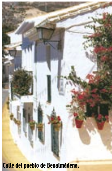
Calle del pueblo de Benalmádena.