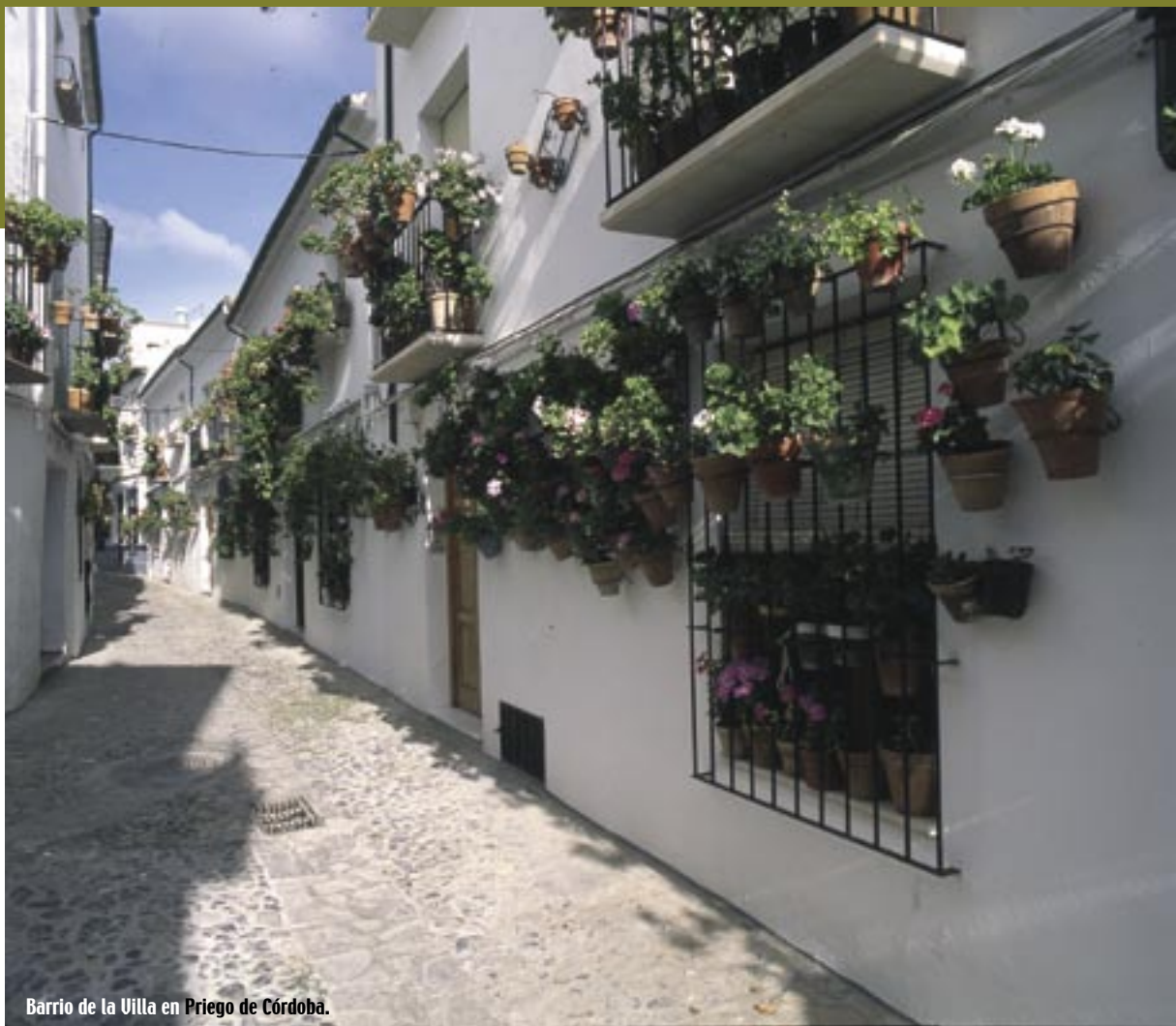
Barrio de la Villa en Priego de Córdoba.

Rábida y Palos en Huelva. Pero sin duda, el legado más valioso del rico pasado histórico andaluz es el carácter hospitalario de sus pueblos, el 'duende' de sus gentes, las delicias gastronómicas y las milenarias tradiciones y fiestas, conservadas con mimo hasta la fecha.