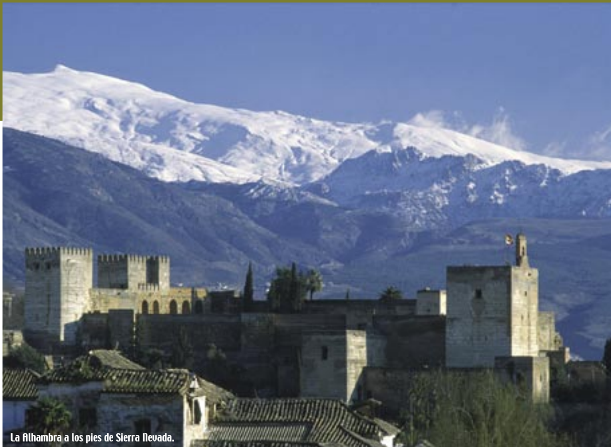
La Alhambra a los pies de Sierra Nevada.