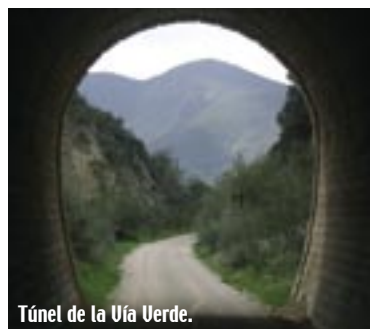
Túnel de la Uía Verde.