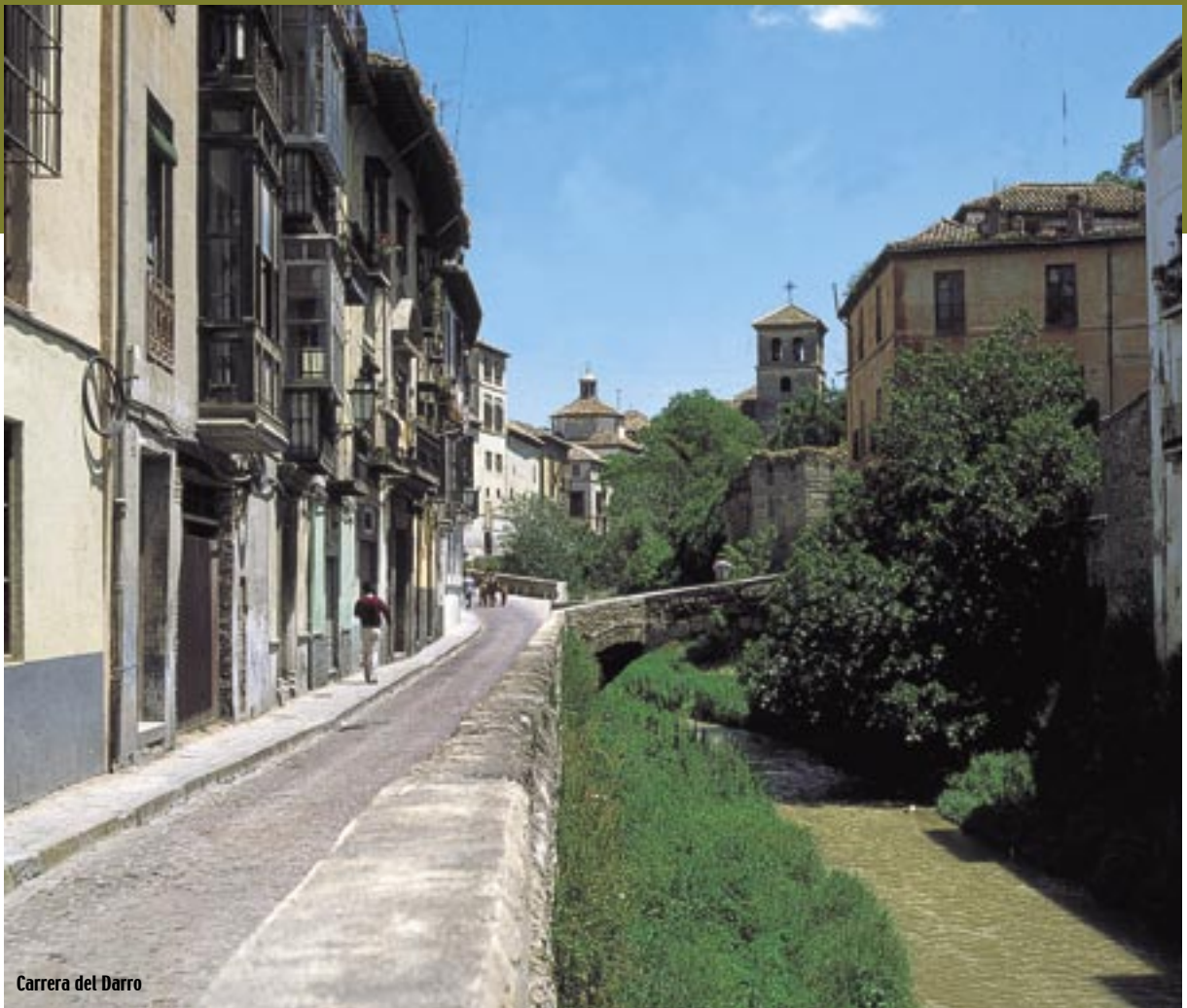
Carrera del Darro

el código de los dos monumentos a los que se quiere favorecer. No hay que olvidar que la Alhambra tiene el Código 02. También se puede mandar un mensaje de texto enviando la palabra "alhambra" al número 5030. Hasta ahora han votado más de 17 millones de personas, y aunque el voto no es gratuito, los fondos obtenidos se invertirán en la restauración de algunas de estas joyas del patrimonio artístico-cultural mundial.