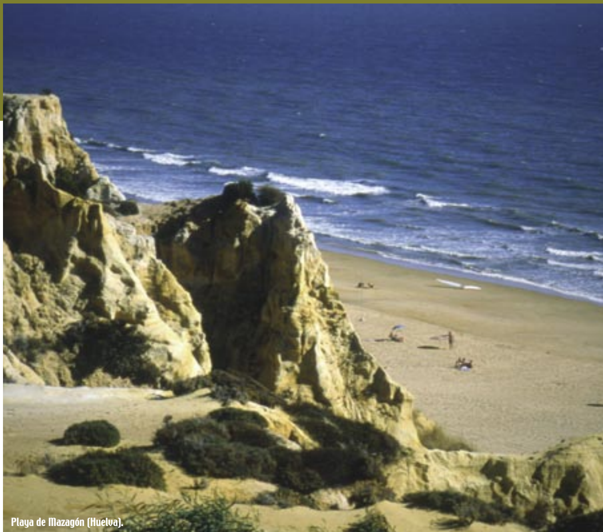
Playa de Mazagón (Huelva).

viajero por el paladar. Cuna del aceite de oliva, tierra fértil de las mejores frutas y verduras, y bañada por dos mares que dan lo mejor de sí mismos a los pescadores, las posibilidades de buen comer son incontables. Desde los 'pescaitos fritos' o a la plancha en la costa a la cocina recia del interior, sin olvidar el preciado jamón ibérico degustado con un buen vino de Jerez.