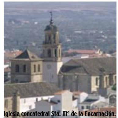
Iglesia concatedral Sta. Mª de la Encarnación.