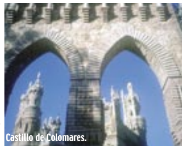
Castillo de Colomares.

eventos a la zona, convirtiéndose tal vez en un futuro en un referente para este deporte a nivel mundial. Son propuestas que no hacen sino afirmar la posición de líder en el sector turístico que ocupa Benalmádena por todas las cualidades, servicios e infraestructuras que posee la ciudad. Porque al margen de la belleza y calidad de sus playas y calas, Benalmádena es un universo de ocio, cultura y lugares interesantes que visitar.