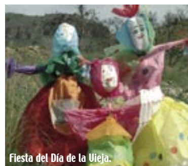
Fiesta del Día de la Vieja.