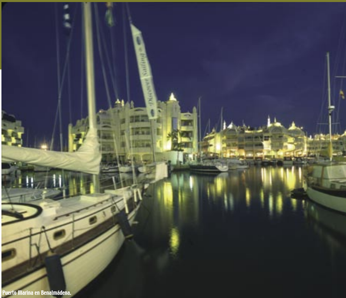
Puerto Marina en Benalmádena.