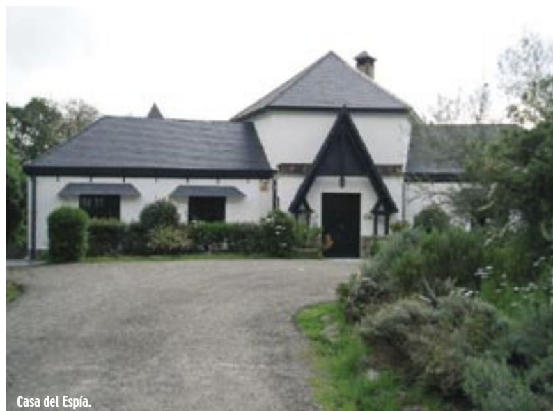
Casa del Espía.