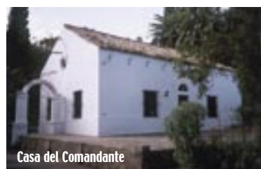
Casa del Comandante