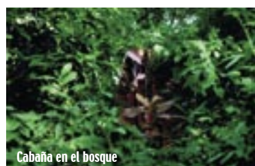
Cabaña en el bosque