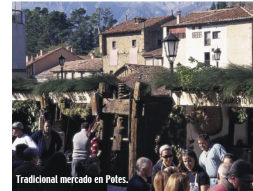
Tradicional mercado en Potes.