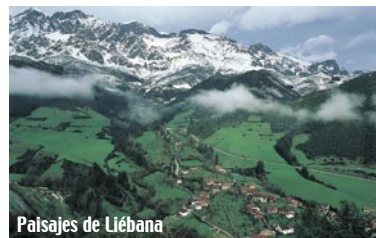
Paisajes de Liébana