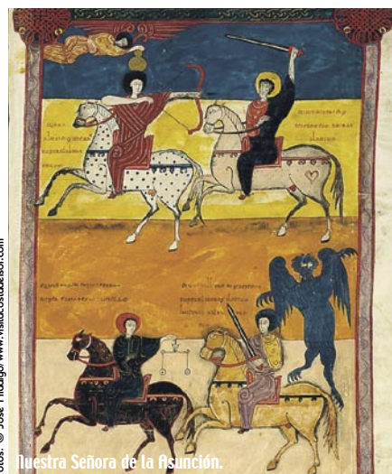
Nuestra Señora de la Asunción.

tos de música clásica y popular, encuentros científicos, actividades teatrales, etc. configurarán el programa cultural en que trabaja la Consejería de Cultura, Turismo y Deporte para dar contenido a este año de celebración en el que más de un millar de actos atraerán a un gran número de visitantes a Liébana y Cantabria. En este programa participarán, entre otros, Bruce Springsteen, Simple Minds, Woody Allen, Scorpions, Chieftains, Estopa, o la Fura dels Baus.