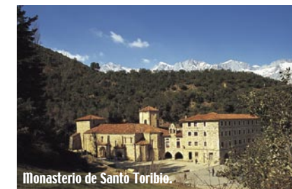
Monasterio de Santo Toribio.