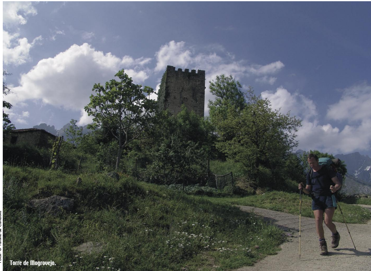
Torre de Mogrovejo.