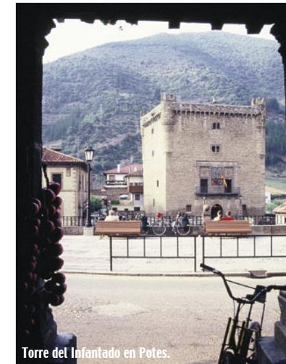
Torre del Infantado en Potes.

Actos culturales Conferencias, exposiciones, concier-