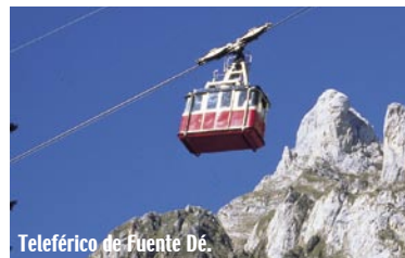
Teleférico de Fuente Dé.