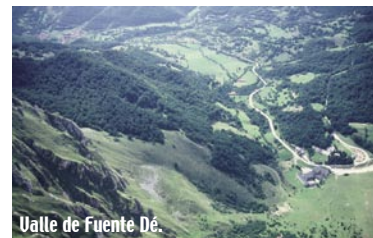
Valle de Fuente Dé.