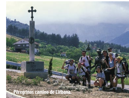
Peregrinos camino de Liébana.

Cable, paraje inigualable donde sentir de cerca la grandiosidad de los Picos de Europa.