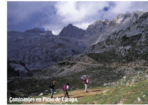
Caminantes en Picos de Europa.

un teleférico salva casi mil metros de desnivel hasta el mirador del