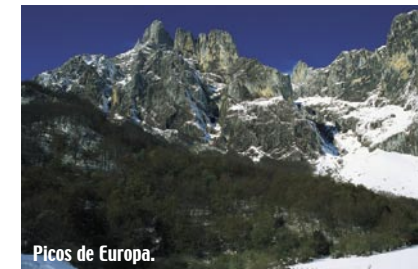
Picos de Europa.

tos de música clásica y popular, encuentros científicos, actividades teatrales, etc. configurarán el programa cultural en que trabaja la Consejería de Cultura, Turismo y Deporte para dar contenido a este año de celebración en el que más de un millar de actos atraerán a un gran número de visitantes a Liébana y Cantabria. En este programa participarán, entre otros, Bruce Springsteen, Simple Minds, Woody Allen, Scorpions, Chieftains, Estopa, o la Fura dels Baus.