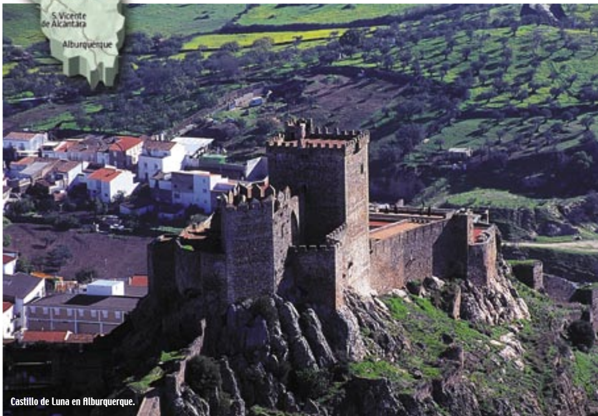
Castillo de Luna en Alburquerque.