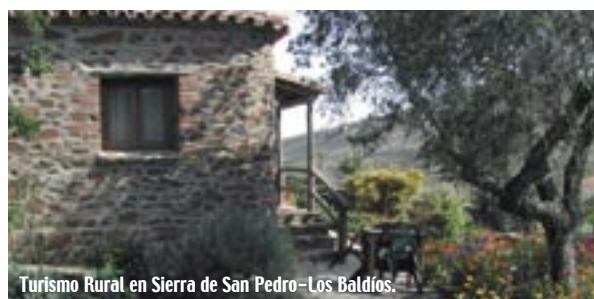
Turismo Rural en Sierra de San Pedro-Los Baldíos.