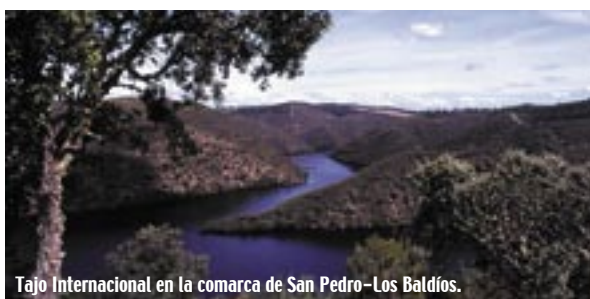
Tajo Internacional en la comarca de San Pedro-Los Baldíos.