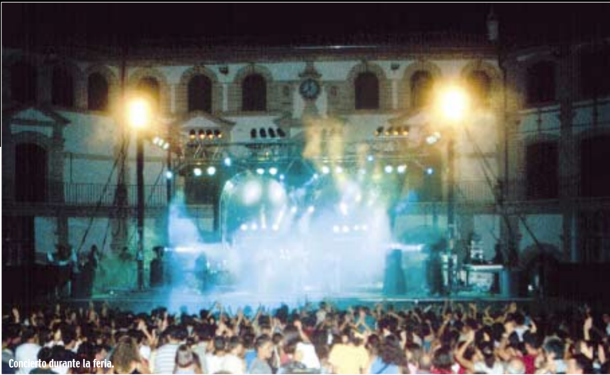
Concierto durante la feria.