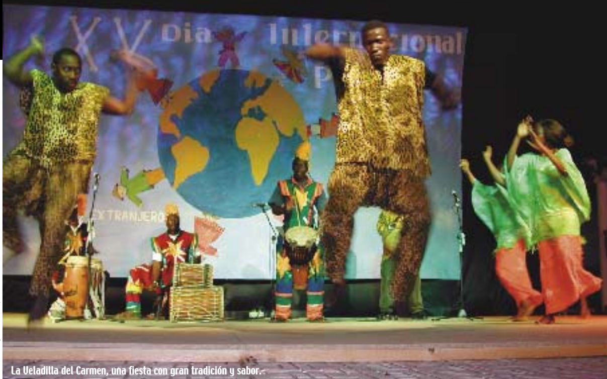
La Veladilla del Carmen, una fiesta con gran tradición y sabor.