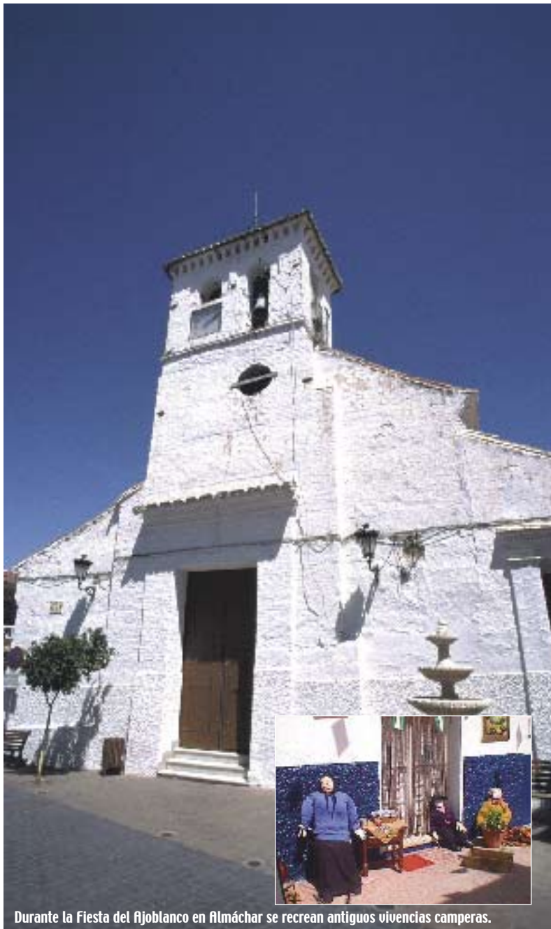
Durante la Fiesta del Ajoblanco en Almáchar se recrean antiguas vivencias camperas.