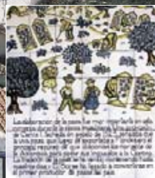
Fiesta de la Pasa. El Borge.