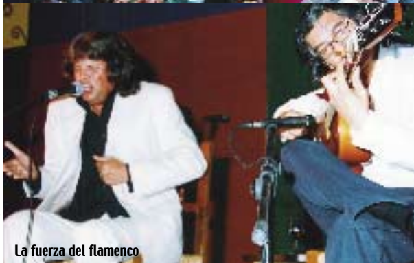
La fuerza del flamenco