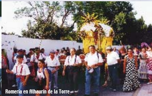
Romería en Alhaurín de la Torre