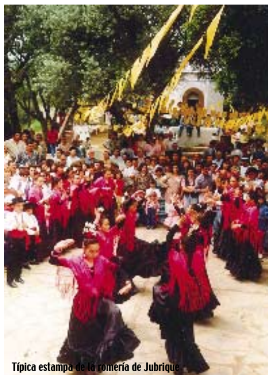
Típica estampa de la romería de Jubrique

La última cita importante del calendario festivo son las fiestas patronales de San Francisco de Asís, la primera semana de octubre). La procesión del Patrón, el toro de fuego, el tostón de castañas, la fiesta del rebujito son alguno de los ingredientes de unas fiestas de marcada impronta popular.