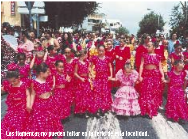
Las flamencas no pueden faltar en la feria de esta localidad.