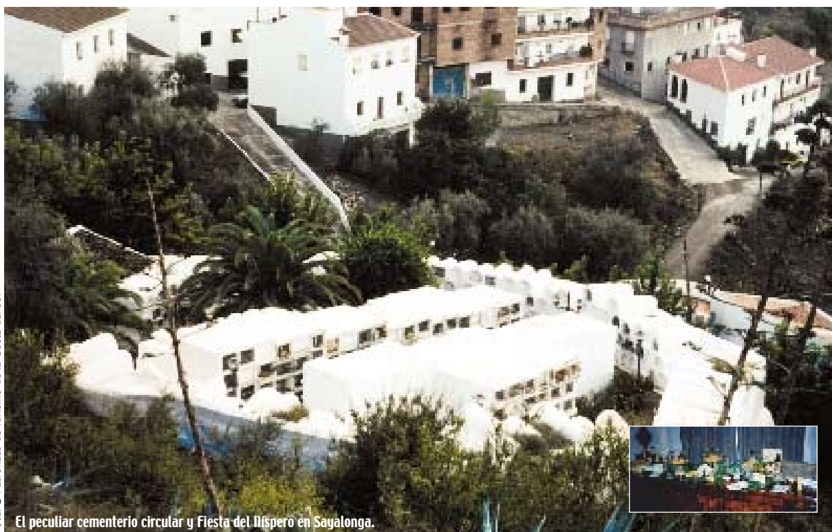
El peculiar cementerio circular y Fiesta del Níspero en Sayalonga.

Casi todas las familias de Sayalonga tienen cultivado algún “peazo” o algún ejemplar en el patio de su casa de la variedad conocida como Golden, originaria de California e introducida hace unos treinta años en estas tierras. Y es que el níspero es una fruta deliciosa ya sea como tal o transformada en mermelada, en conserva, en almíbar, escarchada o en licor. Todas estas “variedades” son preparadas y ofrecidas con sumo cariño en el Día del Níspero para disfrute de todos los visitantes, que podrán así dar fe de la hospitalidad de este bello municipio de la Axarquía malagueña.