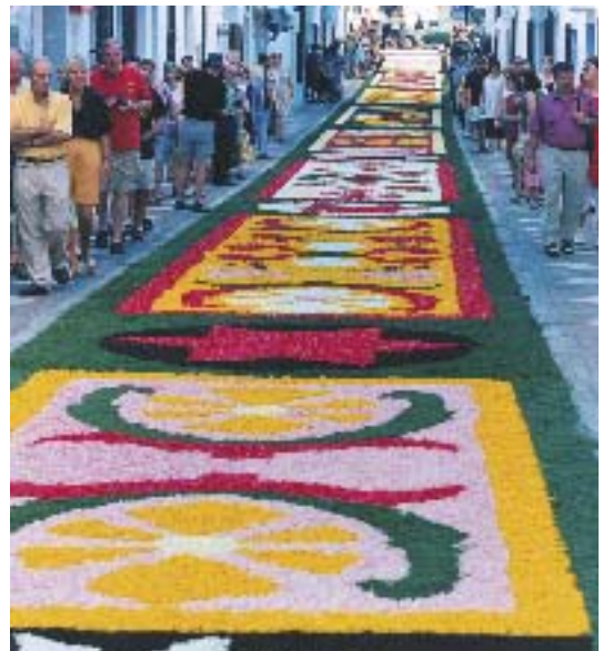
El Corpus en Benalmádena.

procesión marinera, la imagen es trasladada a una embarcación para acudir al encuentro de una procesión en Torremolinos. La última festividad importante del verano es la feria de