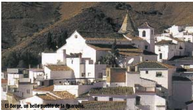
El Borge, un bello pueblo de la Axarquía.