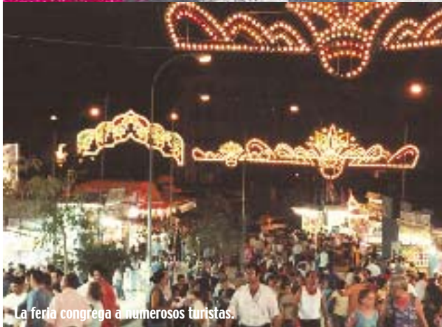
La feria congrega a numerosos turistas.

un tono azul intenso, que compite en belleza con la claridad del cielo, para acoger en su regazo la imagen de la Virgen patrona de los marineros y crear un hermoso cuadro en el que la belleza de ésta resaltará sobre el homogéneo fondo. Los habitantes de Benalmádena acuden al encuentro de la Virgen del Carmen a la que acompañan en procesión por todo el municipio hasta llegar a las orillas del Mediterráneo. Éste la aguarda, como todos los años, para mecerla al compás de las olas que se agitan en un suave arrullo. Tras la