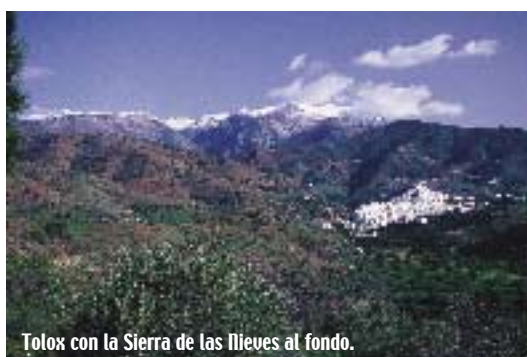
Tolox con la Sierra de las Nieves al fondo.

Distancia a Málaga: 35 Kms. Altitud: 237 m. Extensión: 25,70 km 2 . Habitantes: 1071. Gentilicio: borgeños.