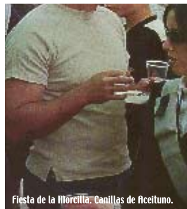
Fiesta de la Morcilla. Canillas de Aceituno.

Canillas del Aceituno celebra el último domingo de abril sus fiestas patronales en honor de la Virgen de la Cabeza. Ese día, una jornada muy especial para todo el pueblo, se degustan más de 3.000 kilos de morcilla, quizás el embutido más