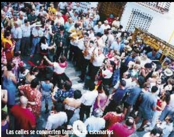
Las calles se convierten también en escenarios