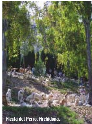
Fiesta del Perro. Archidona.