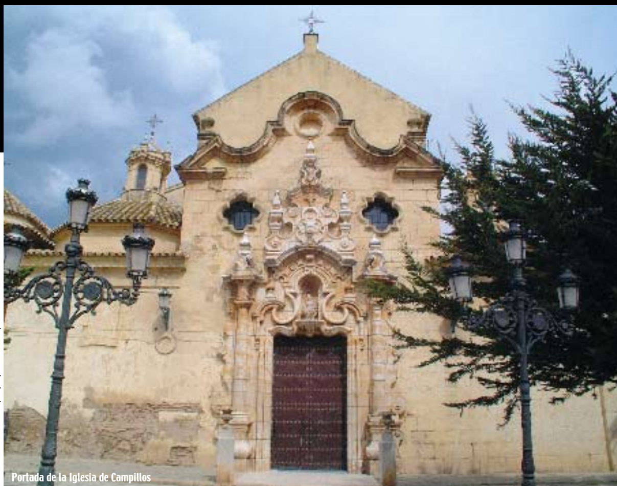
Portada de la Iglesia de Campillos