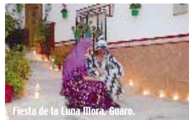
Fiesta de la Luna Mora. Guaro.