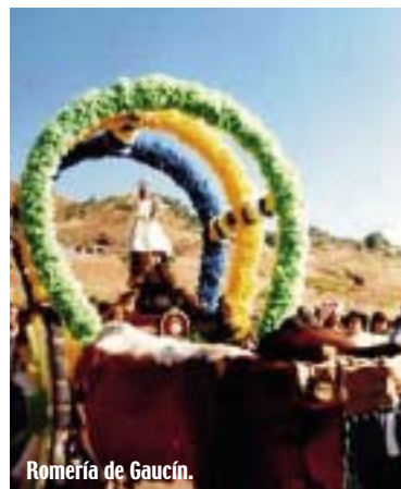
Romería de Gaucín.