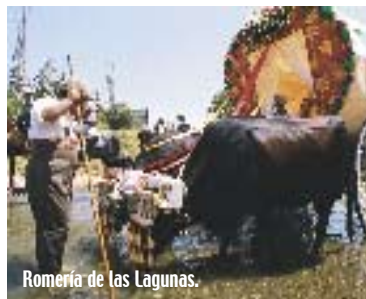
Romería de las Lagunas.

La música en vivo también será protagonista en los meses de estío. Estilos diferentes y sonidos llegados desde muy lejos tendrán su escenario perfecto en la playa de La Cala, con el mar Mediterráneo