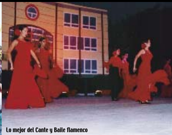
Lo mejor del Cante y Baile flamenco