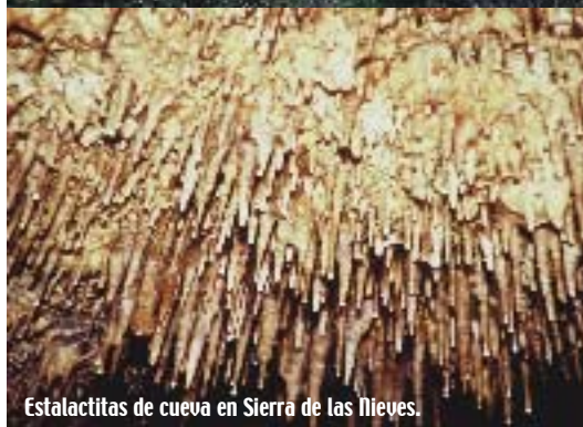
Estalactitas de cueva en Sierra de las Nieves.