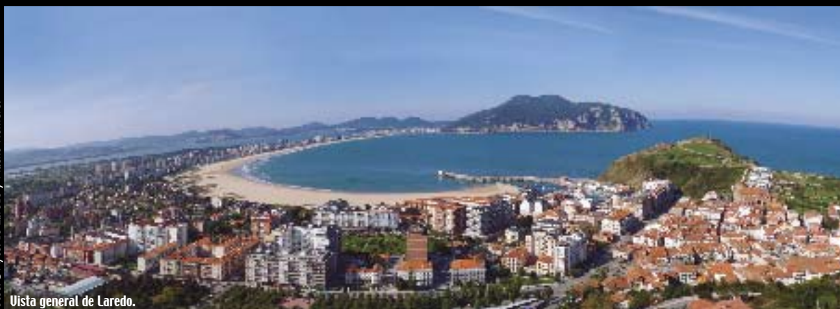
Vista general de Laredo.