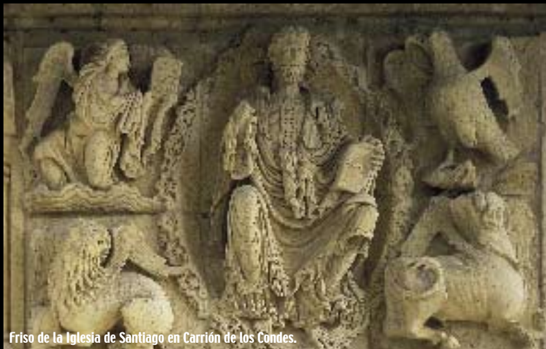
Friso de la Iglesia de Santiago en Carrión de los Condes.