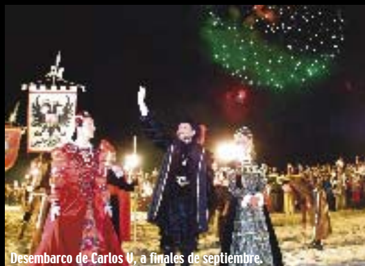
Desembarco de Carlos V, a finales de septiembre.

El Paseo Marítimo y sus playas, junto con los barrios ‘rurales’ de la periferia, son otros lugares que los visitantes no deben olvidar en su estancia en la capital de la Costa Esmeralda.