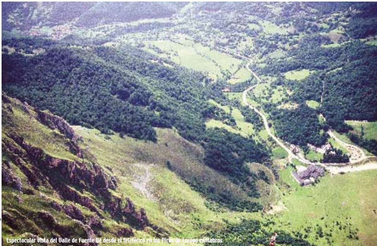
Espectacular vista del Valle de Fuente de Ene desde el teleférico en los Picos de Europa cántabros

Metidos en la Maragatería, el visitante llegará a Astorga donde sed