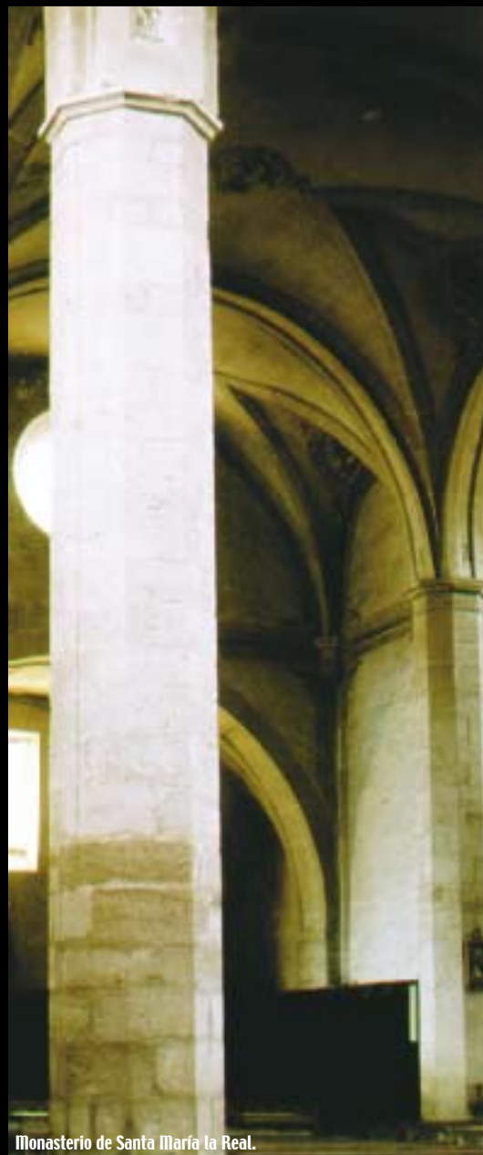
Monasterio de Santa María la Real.

En esta sierra, encrucijada ecológica y climática se levanta un monumento religioso de estilo románico que nos remite directamente a los orígenes del Reino de Aragón.