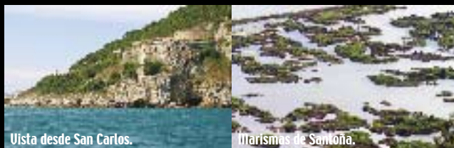
Vista desde San Carlos.