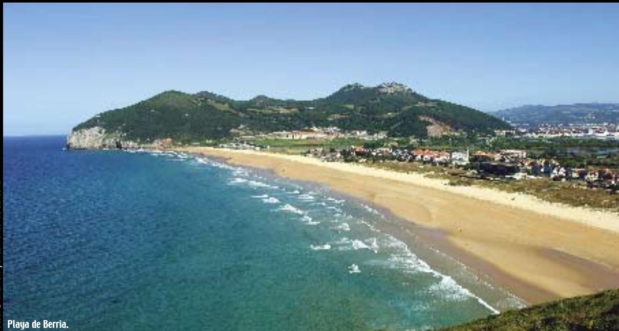
Playa de Berria.