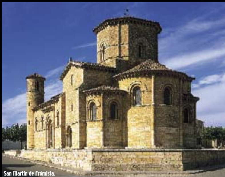
San Martín de Frómista.

Se comienza el recorrido después de atravesar uno de los más bellos puentes que existen en la Ruta Jacobea: Puentefitero, que sirve de límite a las provincias de Burgos y Palencia y peina las aguas del río Pisuerga. El primer pueblo palentino es Itero de la Vega, con la pequeña ermita de la Piedad (s. XIII). Boadilla del Camino conserva, entre otros monumentos, un rollo jurisdiccional gótico del siglo XV que, junto a la iglesia, sirvió para exponer a los reos atados a una argolla de hierro y hoy es uno de los hitos más visitados de esta zona. Saliendo del Camino y como ruta alternativa los viajeros sin prisas deben acercarse a Támara de Campos, pequeño pueblo de casa blasonadas que conserva un impresionante templo de transición entre el gótico y el renacimiento mandado construir por Alfonso XI. Después de Boadilla, las sirgas del Canal de Castilla acompañarán al viajero hasta llegar a Frómista. En la conocida como "Villa del Milagro" hay templos de diversos estilos, aunque destaca entre todos ellos el de San Martín, unos de los mejores ejemplares románicos del mundo. Después de Frómista, el Camino se interna en la zona de la Tierra de Campos, con hermosos pueblos como Población de Campos, Revenga de Campos, Villovieco o Villarmentero de Campos. En nuestra siguiente parada en este recorrido palentino, Villalcázar de Sirga, podremos admirar su iglesia catedralicia de transición entre el románico y el gótico (s. XIII),