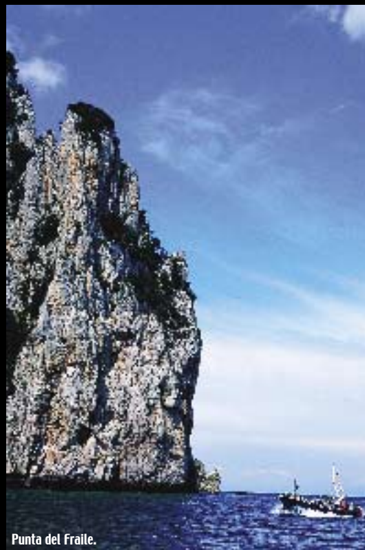
Punta del Fraile.

Las Marismas de Santoña son otro de los atractivos de la localidad, en un recorrido que discurre al norte del casco urbano. La contemplación de la naturaleza más pura es una de las delicias que depara este itinerario de 2.300 metros que se aconseja visitar entre los meses de mayo y septiembre. Pero el medio natural de la villa aún nos depara otra sorpresa: El monte Buciero, poblado de encinas de laurel y madroño, se presenta ideal para los amantes del senderismo. Existen diferentes rutas preestablecidas en las que el caminante, además de disfrutar de un paisaje verde y acogedor.