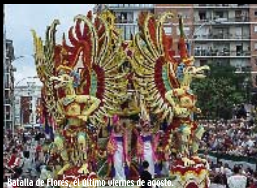
Batalla de Flores, el último viernes de agosto.