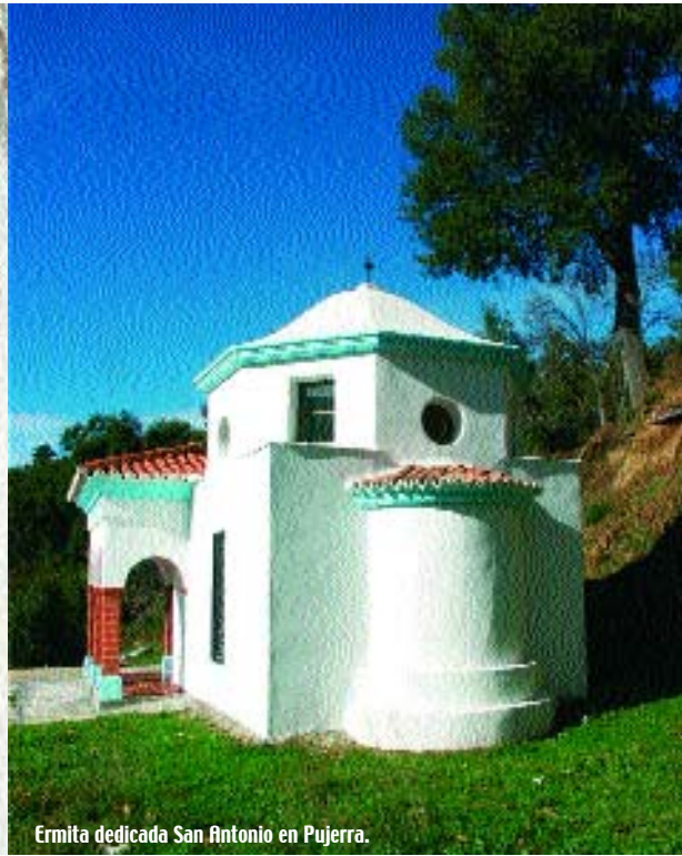
Ermita dedicada San Antonio en Pujerra.

estanque de esperanzas". Y es que esta pequeña localidad despierta la inspiración. El origen de su propio nombre así lo indica, ya que en árabe significa "lugar ameno". Sus alrededores resultan enormemente atractivos para quienes practican el senderismo con sus bosques de encinas, alcornoques, castaños y pinos. Hacia la cima del Romeral, los senderistas pueden contemplar además de restos de obras celtas, el Dolmen de El Romeral y la Cueva de los Almendaraches. Como en otros pueblos del Alto Genal, la Semana Santa es un momento propicio para visitar ya que la noche de Viernes tiene lugar la procesión del milagroso Cristo de Medinaceli, cuyo momento más significativo es la limpieza del rostro de Jesús por una vecina mientras recita una antiquísima poesía de 25 versos.