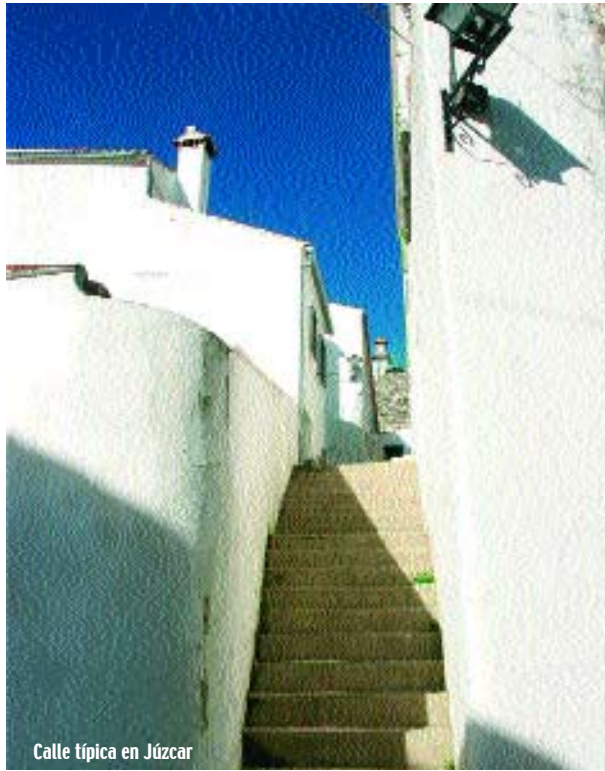
Calle típica en Júzcar