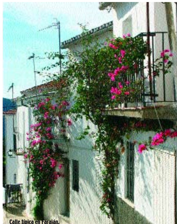
Calle típica en Faraján.