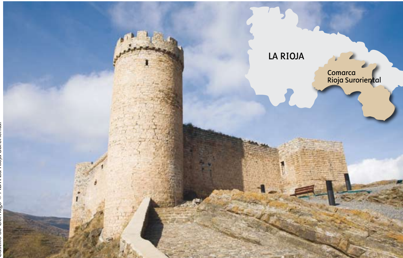
Castillo de Cornago

La Rioja Suroriental está formada por los valles del Cidacos, Alhama-Linares, Ocón y Leza-Jubera. Este territorio destaca por la belleza y diversidad de su medio natural, así como por la importancia de su patrimonio histórico, artístico y cultural.