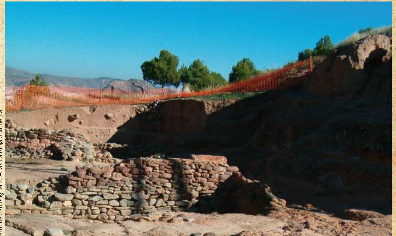
Diversos aspectos del yacimiento Cerro de San Miguel