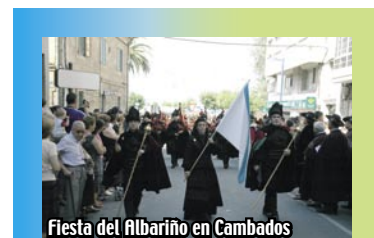
Fiesta del Albariño en Cambados

La Denominación de Origen Rías Baixas ampara los vinos Albariño, Condado de Tea, Rosal, Val do Salnés, Ribeira do Ulla, Rías Baixas, Barrica y Tinto.