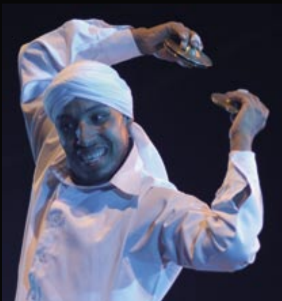
Danzarín derviche en el Festival 2007.