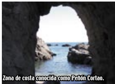
Zona de costa conocida como Peñón Cortao.