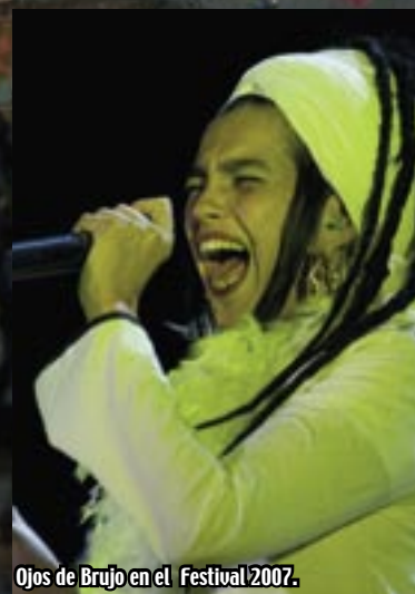
Ojos de Brujo en el Festival 2007.

El festival cuenta con actuaciones musicales de alto nivel artístico en un entorno relajado y familiar; conferencias sobre temas relacionados con las tres culturas, exposiciones, jornadas gastronómicas y una muestra de la gastronomía popular en la ya muy exitosa Ruta de la Tapa en diferentes bares del pueblo. Las actividades de animación de calle incluyen pasacalles con música, juegos malabares, fakir, danza del vientre y también actividades infantiles con juegos tradicionales, cuentacuentos, teatro infantil, títeres.... Todo ello con un mercado de las tres culturas en el que se ofrecen originales productos al visitante llenando las calles con un ambiente cosmopolita y festivo.