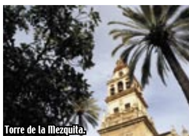
Torre de la Mezquita.