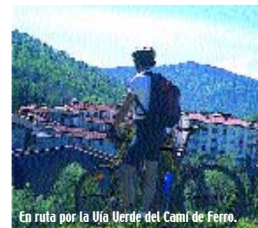
En ruta por la Vía Verde del Camí de Ferro.

gozar las incomparables vistas del infinito bosque que cubre las montañas vecinas, llegando finalmente al apeadero de Font Picant, por el tramo más bello del recorrido, atravesando una densa masa de bosque mediterráneo que transmitirá al viajero calma y serenidad, estados de ánimos que nos acompañarán hasta Castell d'Aro, desde donde iniciaremos la remontada hacia la ladera que cierra la Val d'Aro e internarnos, dos kilómetros más adelante en Sant Feliu de Guixols, punto ideal para bajar a las maravillosas playas de Sant Pol, apenas a 200 metros.