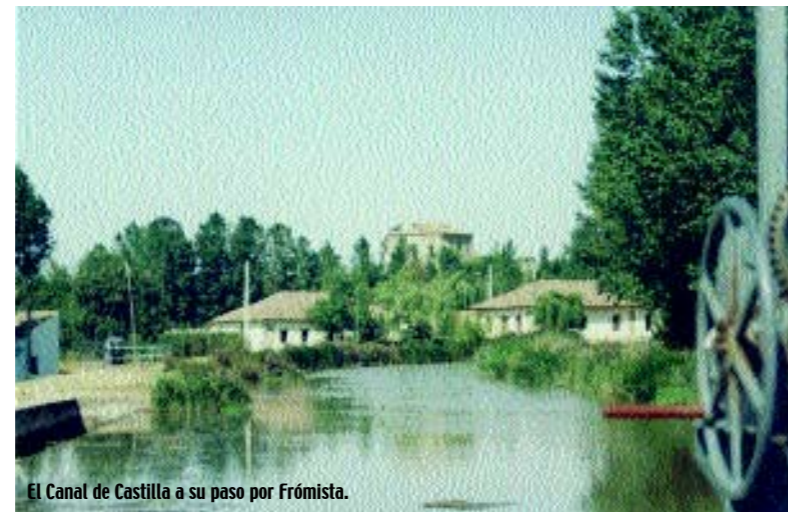
El Canal de Castilla a su paso por Frómista.

Los parajes que rodean a este municipio palentino, surcado por numerosos cursos de agua como el río Ucieza y arroyos como el de Cedrón y Valdemaría, poseen un gran valor natural y paisajístico. Merece especial atención el entorno del Canal de Castilla, construido a mediados del siglo XVIII, en cuyos alrededores surge un auténtico