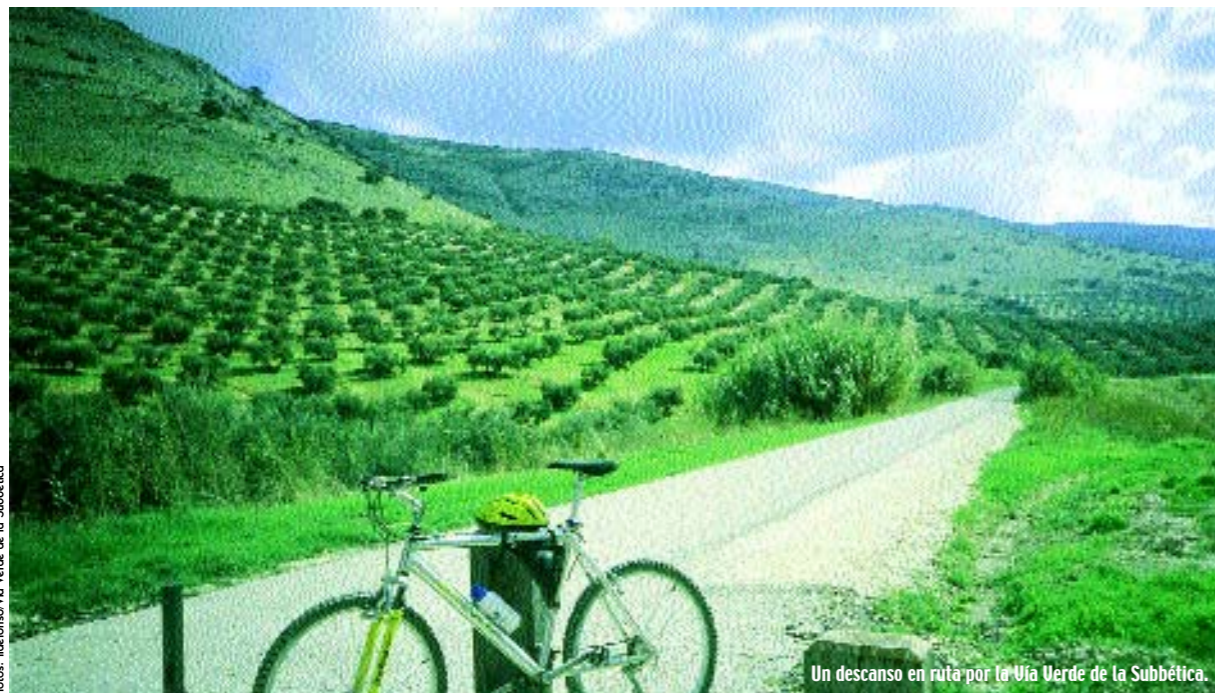
Un descanso en ruta por la Vía Verde de la Subbética.

Corazón de la Vía Verde de la Subbética >>