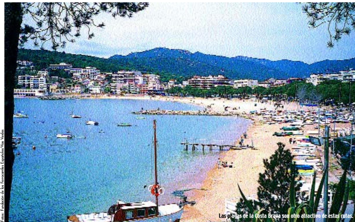
Las playas de la Costa Brava son otro atractivo de estas rutas.

DEL PIRINEO AL MAR, DE LOS VOLCANES DE LA GARROTXA A LOS BOSQUES MEDITERRÁNEOS DEL BAIX AMPURDÀ, ACOMPAÑANDO EN SU RECORRIDO A IMPORTANTES RÍOS COMO EL TER Y ATRAVESANDO PUEBLOS Y CIUDADES CON UN IMPRESIONANTE PATRIMONIO CULTURAL, LAS TRES VÍAS DE GIRONA FORMARÁN A PARTIR DE 2004 UNA DE LAS VÍAS VERDES MÁS GRANDES DE ESPAÑA. UNA RUTA DE 135 KILÓMETROS QUE RECUPERA LOS TRAZADOS DE LOS FERROCARRILES RIPOLL-SANT JOAN DE LOS ABADESSES, OLOT-GIRONA Y GIRONA-SANT FELIU DE GUIXOLS.