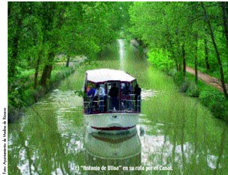
El "Antonio de Ulloa" en su ruta por el Canal.

NAVEGAR POR EL CANAL DE CAMPOS, RAMAL DEL DE CASTILLA Y CONTEMPLAR EL EXTRAORDINARIO ENTORNO QUE LO RODEA SE CONVERTIRÁ EN UNA EXPERIENCIA INOLVIDABLE PARA AQUELLOS QUE VISITEN ESTA LOCALIDAD VALLISOLETANA, POR DONDE ATRAVIESA UN RAMAL DE ESTA MARAVILLOSA OBRA DE INGENIERÍA HIDRÁULICA QUE TAMBIÉN PERMITE LA PRÁCTICA DE NUMEROSAS Y DIVERSAS ACTIVIDADES NÁUTICAS.