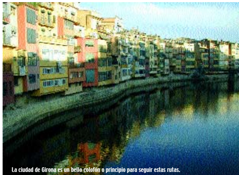
La ciudad de Girona es un bello colofón o principio para seguir estas rutas.

Girona, pasando por zonas tan espectaculares como el Paso de la Pilastra y el Parque de la Devesa. En el corazón de la capital de Girona, comienza un nuevo recorrido. Se trata de la vía verde Girona-Costa Brava, que nos llevará hasta las cálidas orillas del Mediterráneo. El primer pueblo de este tramo es Quart, cuya estación es un claro ejemplo del perfecto estado de conservación de la mayoría de las estaciones de este carrilet. La vía prosigue por un recto trazado y, tras pasar la zona de Can Torrent, llegamos a Cassá. Pasada la estación de Llagostera, la vía se topa con una carretera desde donde se podrán