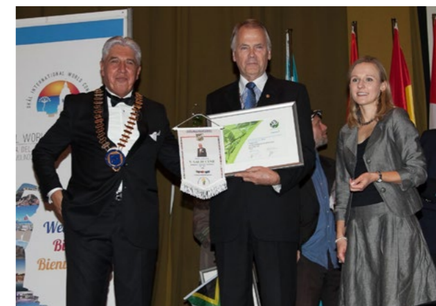
Premio de Skål International para Fjord Line