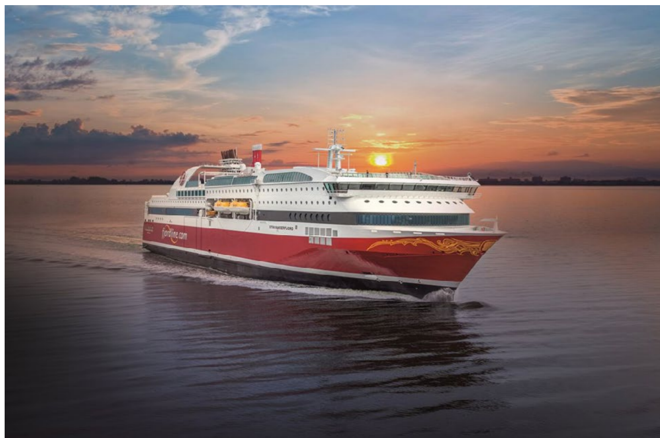
Fjord Line opera principalmente en los países nórdicos.