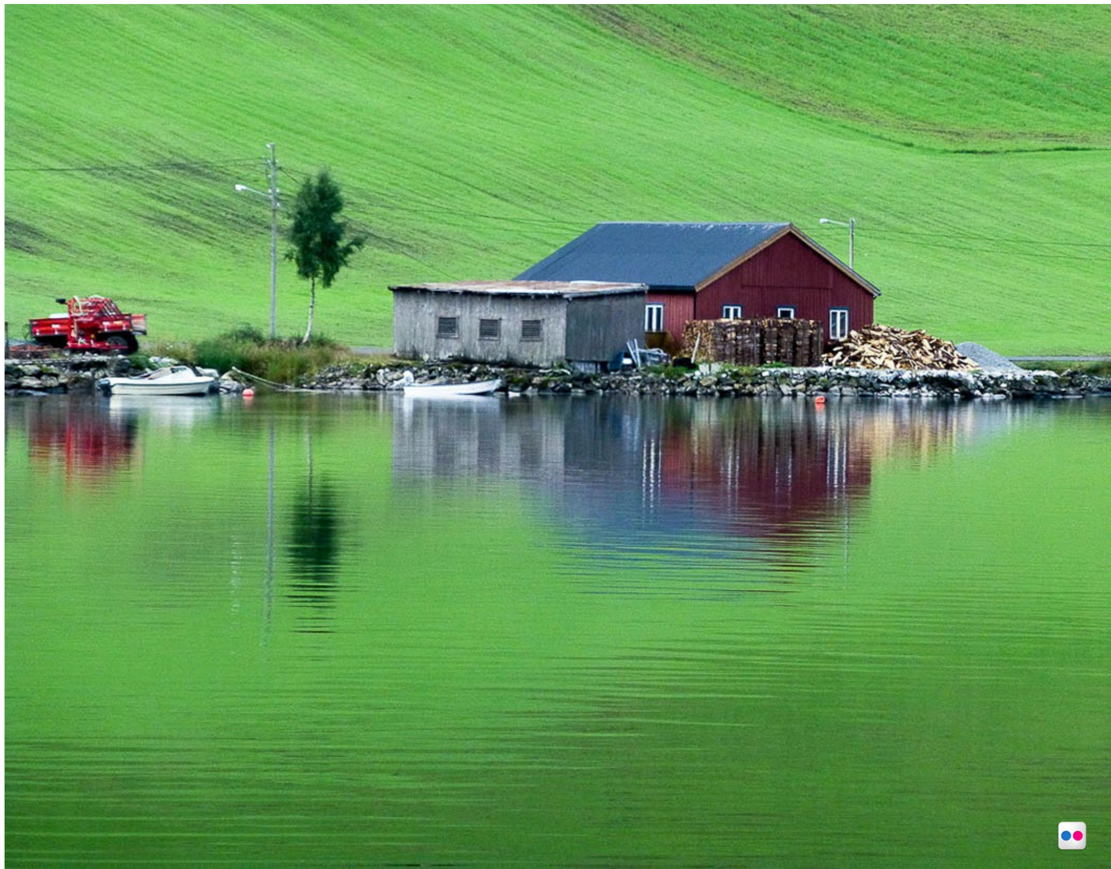
Granja en los fiordos noruegos